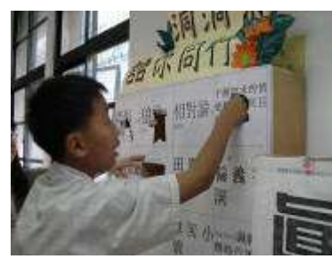
發現洞中獎品的驚奇