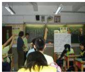
踴躍搶答三國歇後語