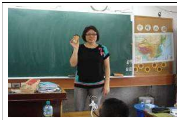
〈麥當勞套餐最受歡迎〉