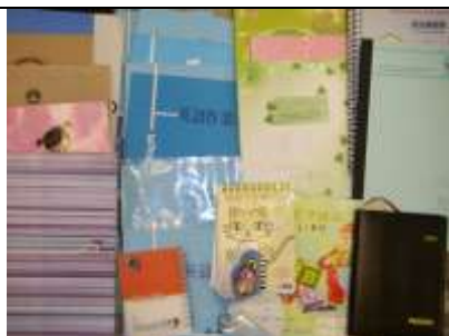
琳瑯滿目的生字本