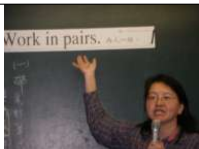
老師帶著唸每日一句