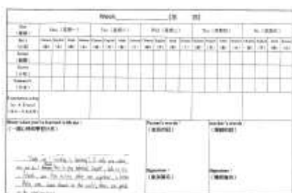
學生英文週記範例