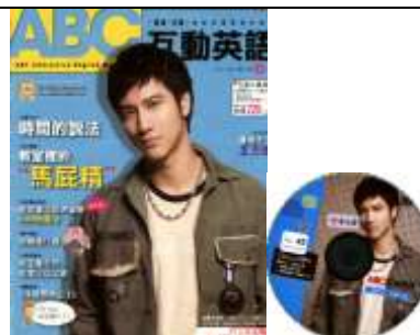
ABC 互動英語雜誌教材