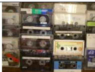
學生的課文錄音帶