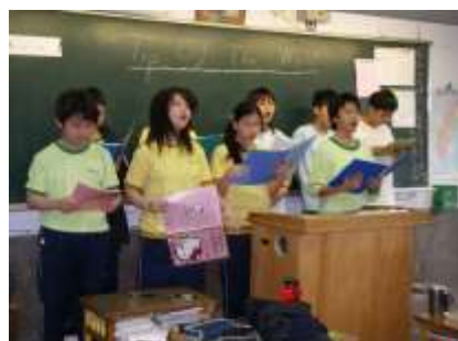
唱歌學英文上課情景