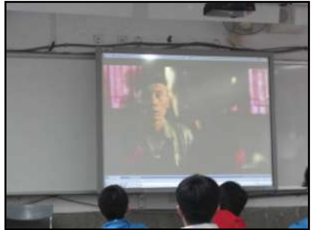
觀賞電影「活著」引導學習中華人民共和國掌權前後各階段的發展