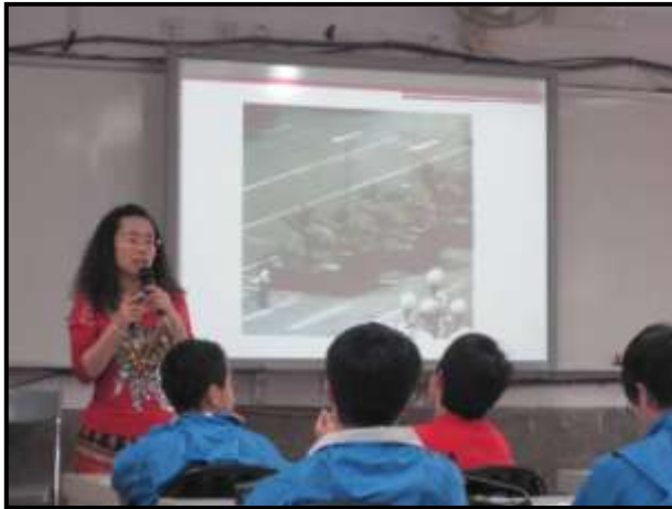
講述六四天安門事件