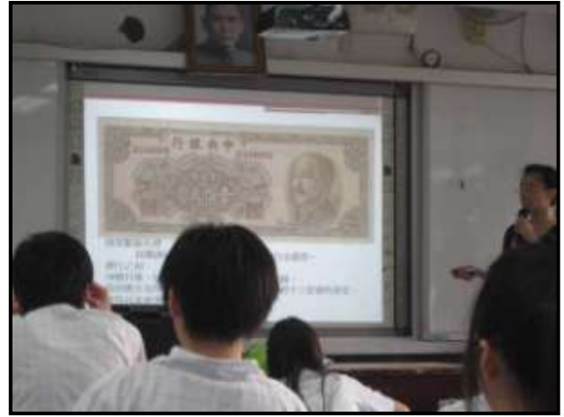
抗戰後的通貨膨脹