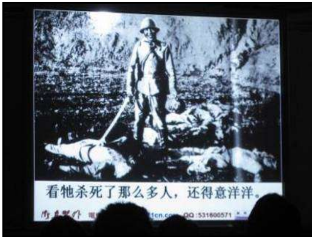
日本侵華-南京大屠殺