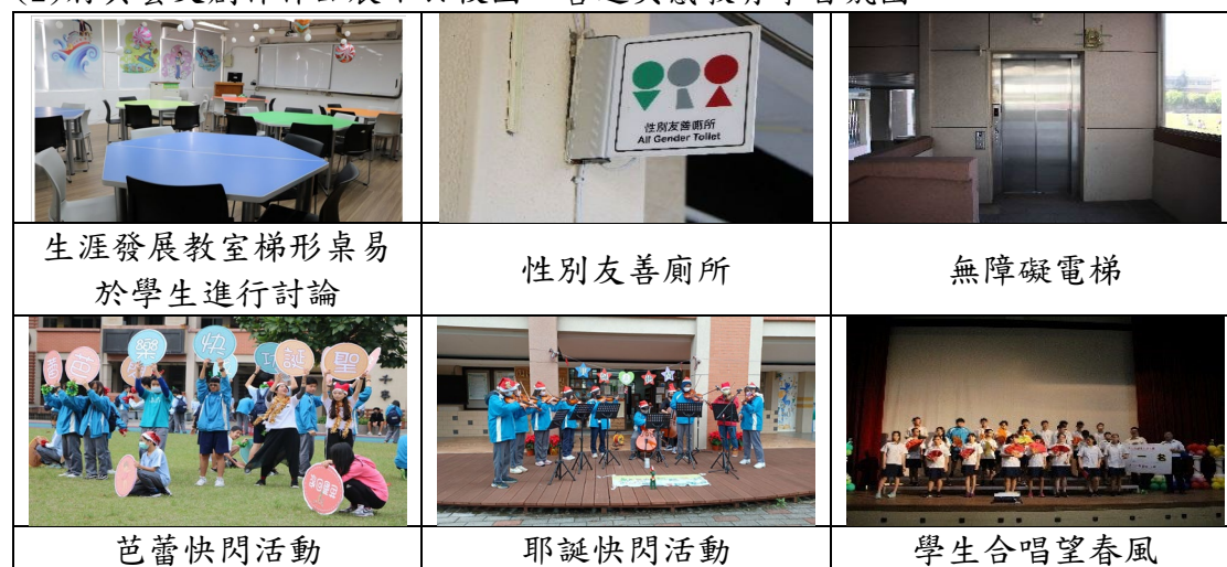
指標 2.2：設置藝術的校園空間