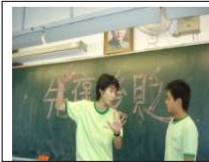
相聲表演：見光碟---附件九

星期假日，我們到一家美輪美奐的餐廳用餐，才到門口，就發現餐廳裡已經人山人海了，我們迫不及待地衝進去準備大快朵頤。大家點了看起來令人垂涎三尺的套餐，品嚐時卻味同嚼蠟，讓我們非常失望。