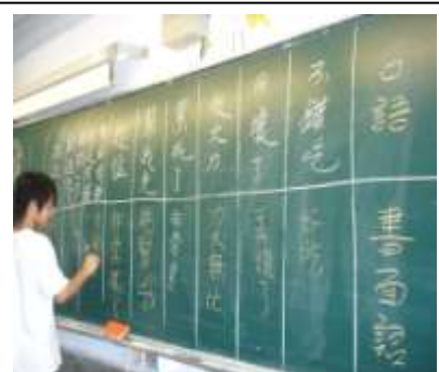
口語書、面語修改實錄