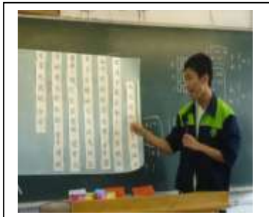
同學上台分享批改結果