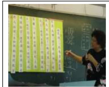
老師檢討修正批改結果