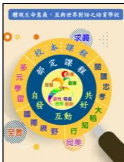
忠孝國中願景圖像

忠孝國中以「體現生命意義，並與世界對話之培育學校」建構學校的願景，在科技與人文的「全人教育」目標下，成就每一個孩子，並建立學校的特色。尤其針對不同學生特質與程度，設置數理資優班及學習資源中心，以進行抽離式的教學。期盼在多元課程設計及教學策略的引導下讓具不同需求的學生能在校園「自主學習」，和同儕「溝通合作」，習得「科技思辨」素養，成就自身「美好品格」。有效學習、健康成長以營造學生樂在學習的優質學園。