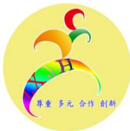
忠孝國中願景圖像

忠孝國中以「尊重、多元、合作、創新」建構學校的願景，在科技與人文的「全人教育」目標下，成就每一個孩子，並建立學校的特色，讓學生能在校園「自主學習」，和同儕「溝通合作」，習得「科技思辨」素養，成就自身「美好品格」。有效學習、健康成長以營造學生樂在學習的優質學園。