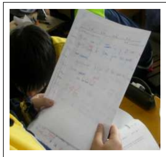
聆聽老師講解文章