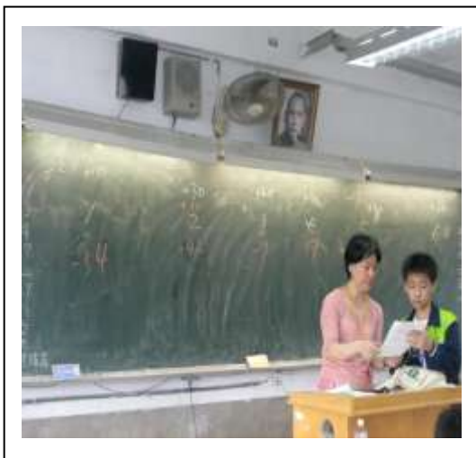
評分記錄於黑板上