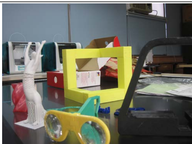
印製 3D 作品