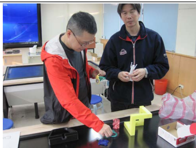
討論作品融入製圖教學