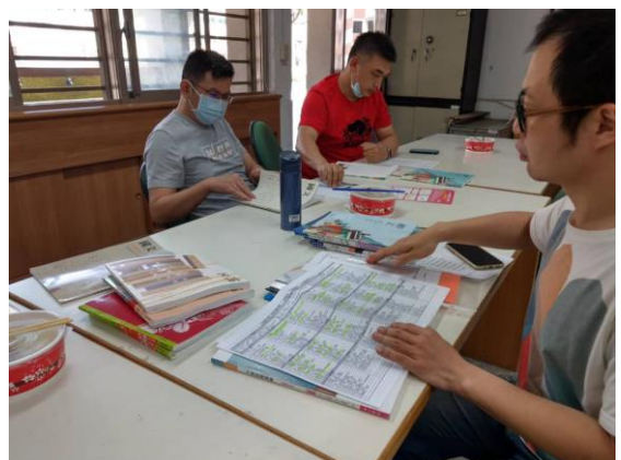
▲領域同仁進行教科書評選