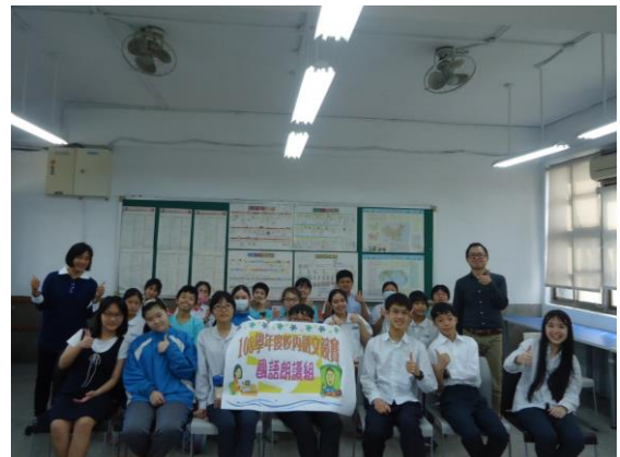
▲國語朗讀組評審與參賽同學合照