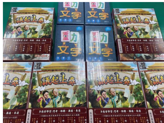
▲國文領域採購桌遊〈趣文字〉、〈議起上奏〉