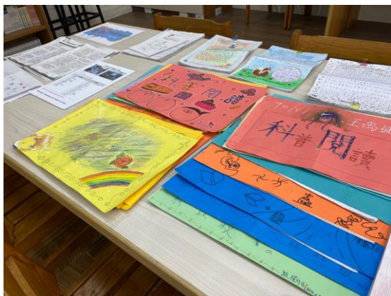
▲彈性課程〈科普閱讀〉學生作品集