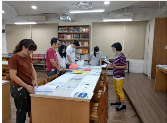
▲國文科教師參觀彈性課程成果展