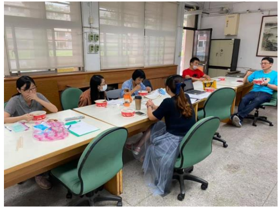
▲領域同仁進行〈紙船印象〉共備與議課

彈性學習課程主要以形塑學校教育願景，及強化學生適性發展。 108學年度本校彈性學習課程如下：