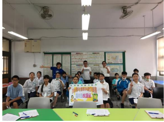
▲閩南語朗讀組評審與參賽同學合照