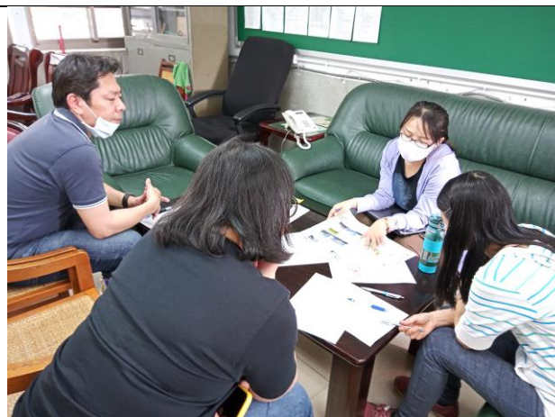
*照片三：【內聘講座】108 課綱八年級地理「東北亞」課程探討暨公開授課之共同備課