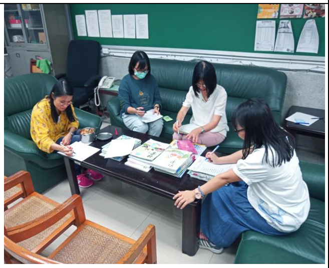
*照片八：各版本教科書評析