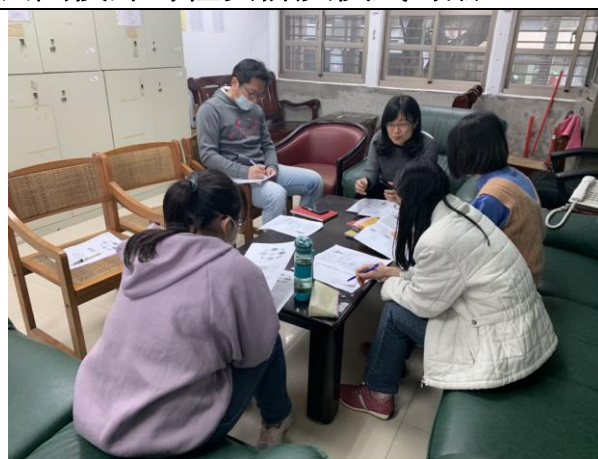
*照片二：校長蒞臨指導，說明 KTAV 教學模式及新五倫