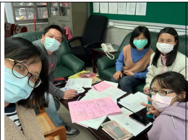
*照片一：領域各項工作安排、公開授課時程安排及模式討論