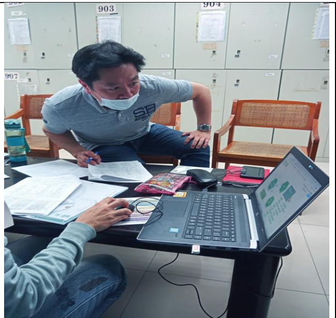
*照片：110 領域課程計畫編寫說明