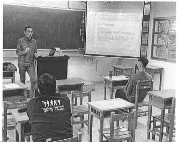
圖說：經歷與經驗分享