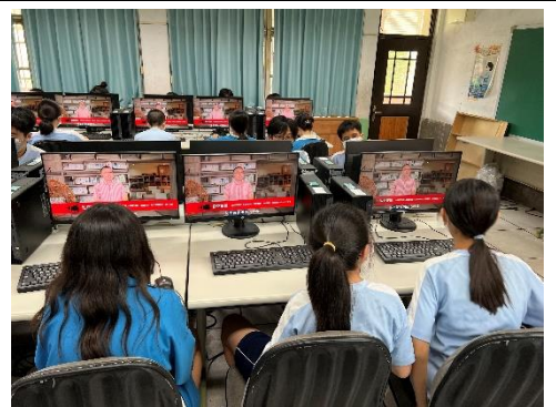
觀看防災教育宣導影片