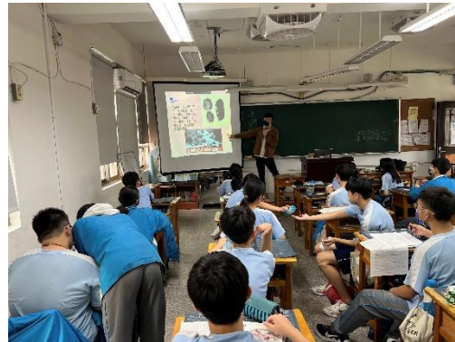
毒品防制融入課程