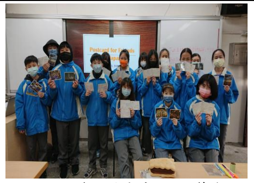
國際交流經驗分享-國際筆友