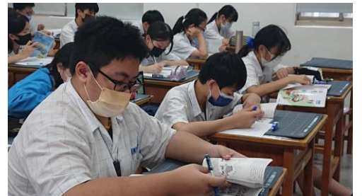
彈性課程-中西經典閱讀