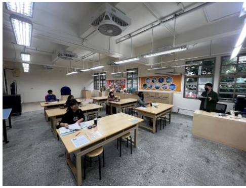
英語節慶教學分享