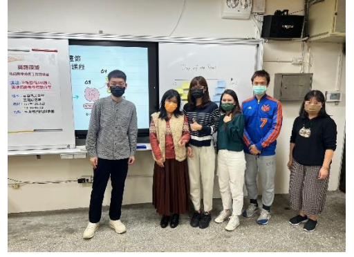
英語節慶教學分享-七靈節