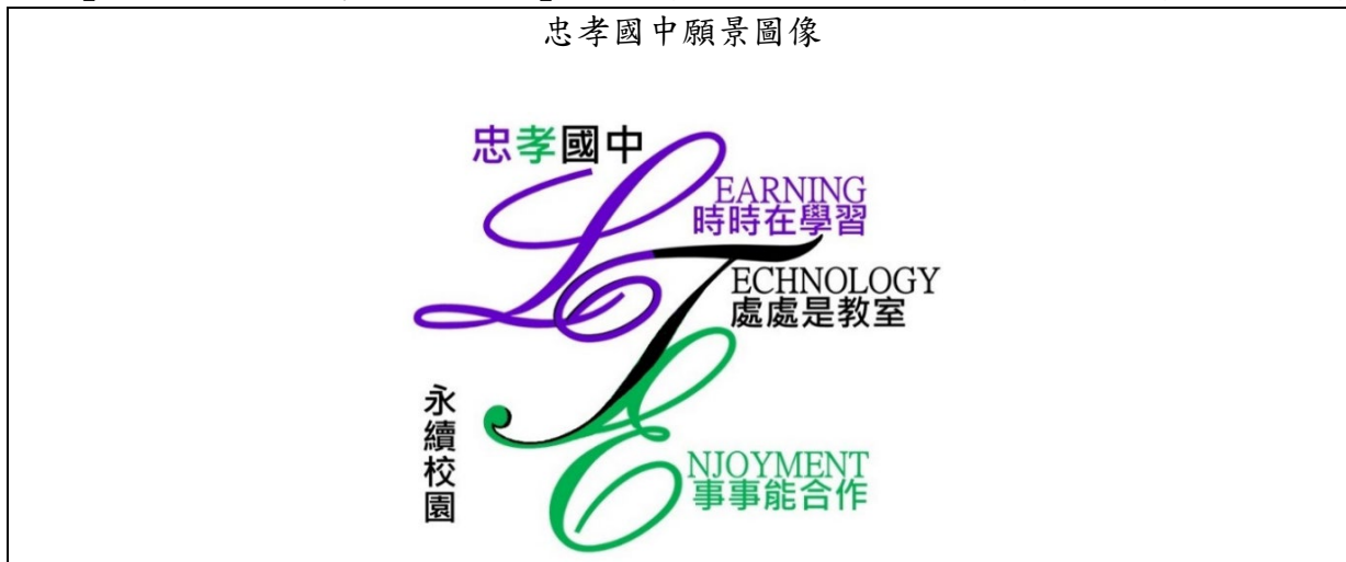
忠孝國中願景圖像

忠孝國中以「體現生命意義，並與世界對話之培育學校」建構學校的願景，在科技與人文的「全人教育」目標下，成就每一個孩子，並建立學校的特色。尤其針對不同學生特質與程度，設置數理資優班及學習資源中心，以進行抽離式的教學。期盼在多元課程設計及教學策略的引導下讓具不同需求的學生能在校園「自主學習」，和同儕「溝通合作」，習得「科技思辨」素養，成就自身「美好品格」。有效學習、健康成長以營造學生樂在學習的優質學園。