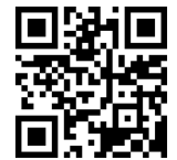
報名 QR Code