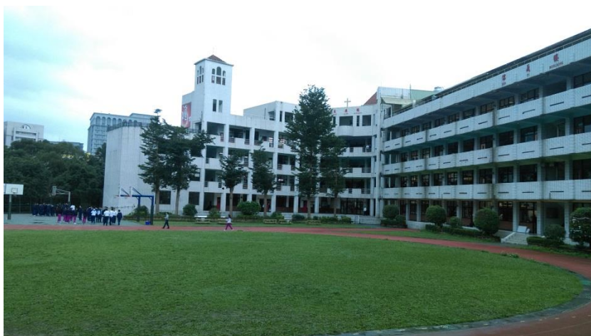
圖(一)飛行競賽場地