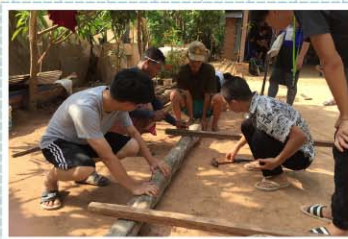
東單愛國際志工>>> 志工們與柬埔寨當地農村村民一同修建房屋，勞動付出的同時分享愛