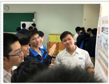
美術課程>>> 以視覺圖像介紹各國博物館