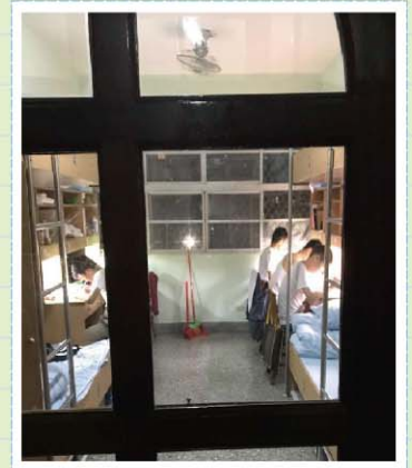
住宿生活>>>宿舍自修現況