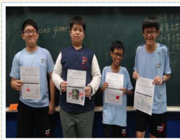
英語會話>>> Self-introduction 讀劇表演