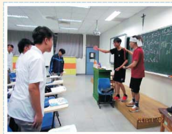
第二外語課程>>> 開設日語及韓語課程