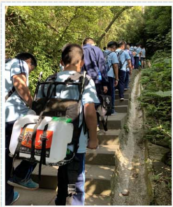
校訂課程>>> 野學措水，服務奉獻