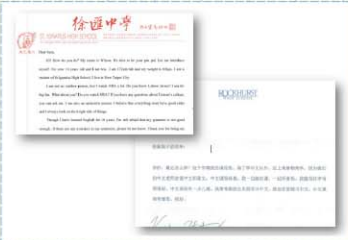
與美國Rockhurst高中學生書信交流