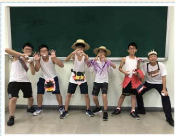
表演藝術課程>>> 服裝設計與走秀