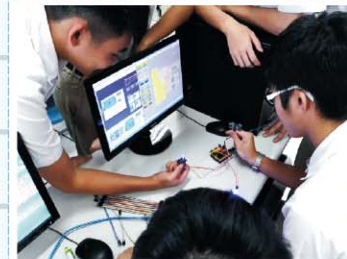
機器人社>>> 汲取STEM教育的精神，加強實作創新、 跨領域能力的培養；整合科學、工程、 技術、數學，經由資料收集、研究討論、 實作等步驟加強自主學習能力