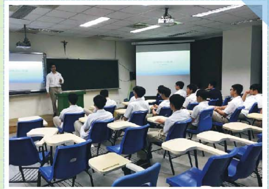
高中部住宿生繁星上榜學長給現有住宿生住宿經驗及考試準備分享座談