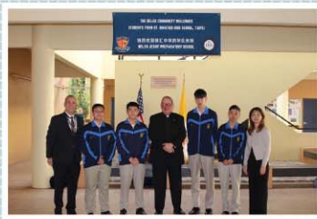
徐匯學生至美國邁阿密Belen中學體驗學習