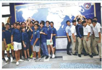
美國邁阿密Belen中學畢旅來訪