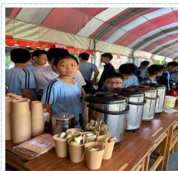
校慶暨仁愛濟貧園遊會>>> 各班級設攤位義賣，所得捐獻社會公益團體及本校清貧學生，實現「從做中學」之教育方法，增進學生規劃執行活動之能力。