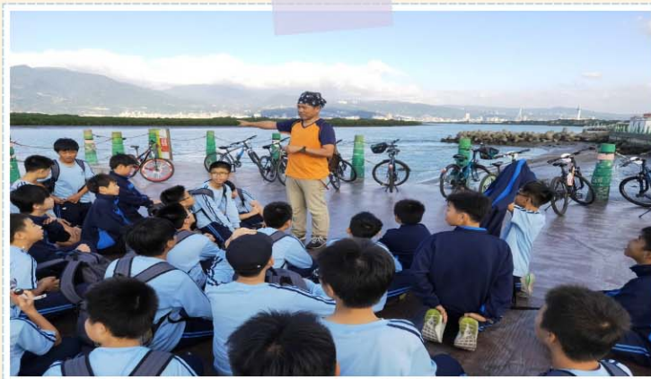
校訂課程>>> 野學環境教育(踏騎)