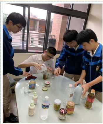
自然科實作課程>>> 利用橘皮自製天然清潔劑