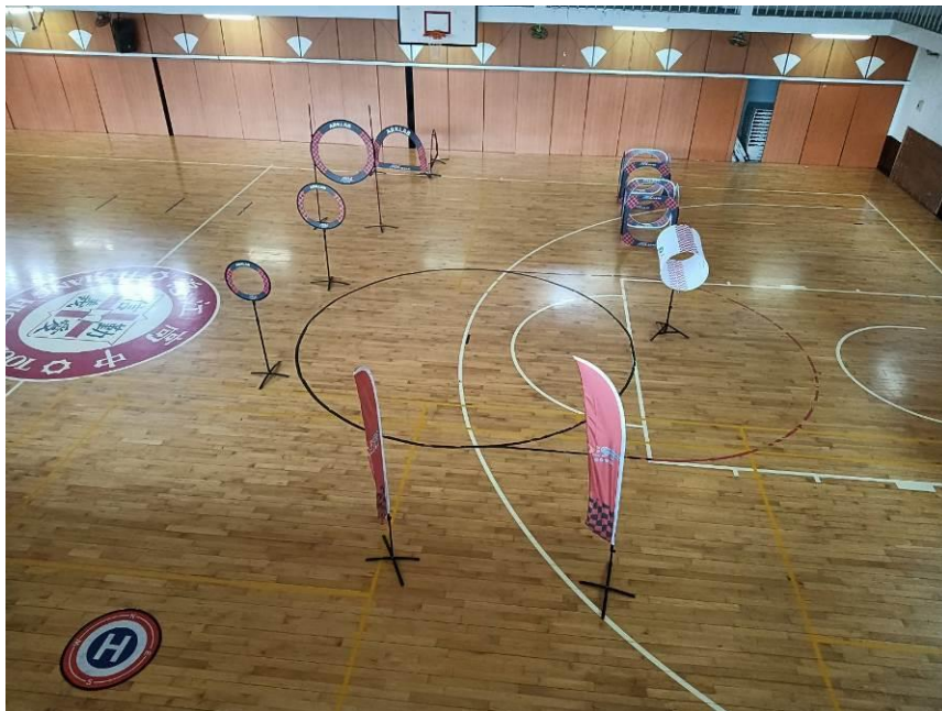
圖(一)無人機競速體驗活動室內場地