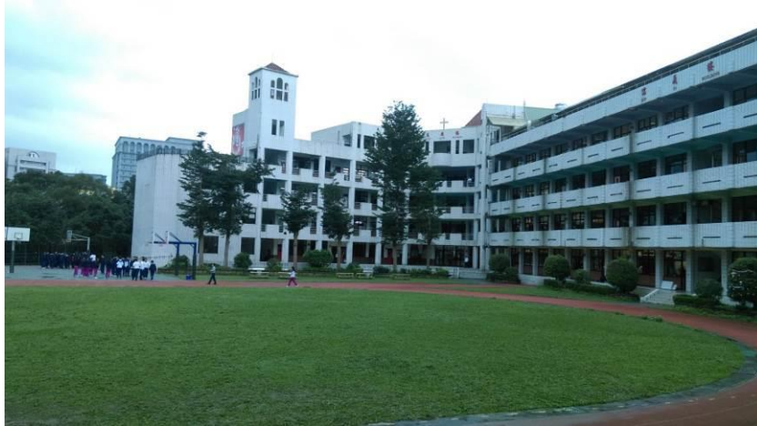
圖(二)飛行競賽場地