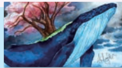
學生作品 - 西畫類