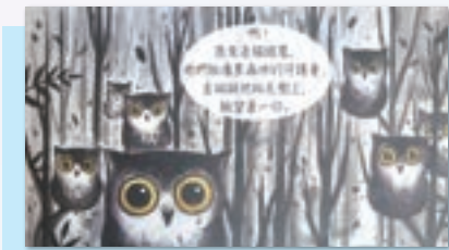
學生作品 - 繪本