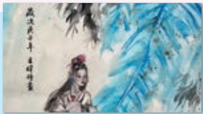
學生作品 - 水墨畫類