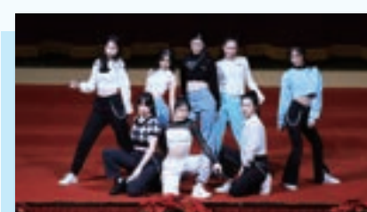
Revel Dance Team