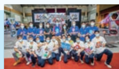
Taipei Fuhsing Robotics Club