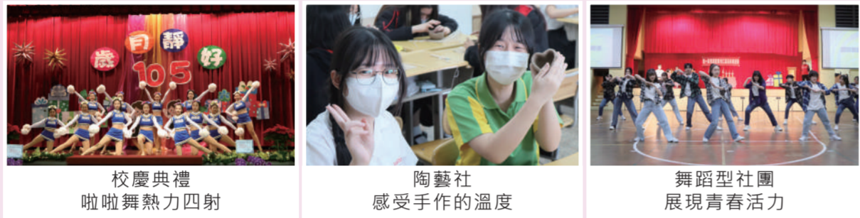
校慶典禮啦啦舞熱力四射 | 陶藝社感受手作的溫度 | 舞蹈型社團展現青春活力

本校重視多元發展，透過體驗、省思及實踐，建構自我價觀與意義，增強解決問題能力，強化團隊合作服務及促進全人發展。111學年度共設有24個社團，其中啦啦舞社成員盡情發揮舞蹈能力，於2022年全國啦啦隊挑戰賽，榮獲彩球指定動作高中組第一名佳績。參與比賽的過程，不怕辛勞，更能學習合作與人際互動。