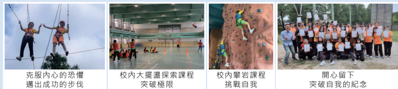
克服內心的恐懼邁出成功的步伐 | 校內大擺盪探索課程突破極限 | 校內攀岩課程挑戰自我 | 開心留下突破自我的紀念

本校自2007年開始發展探索教育為校本課程，更於2018年榮獲教育部「戶外教育成果」金牌獎。我們重視孩子的心靈成長，因此致力推動校內的「平面課程」、「大擺盪」、「攀岩」及校外「龍潭外展高空繩索活動」，期盼讓學生藉此學習與同儕互動和自我挑戰，以促進情境教學與生活連結，強化個人決策、問題解決與反思的能力與態度。