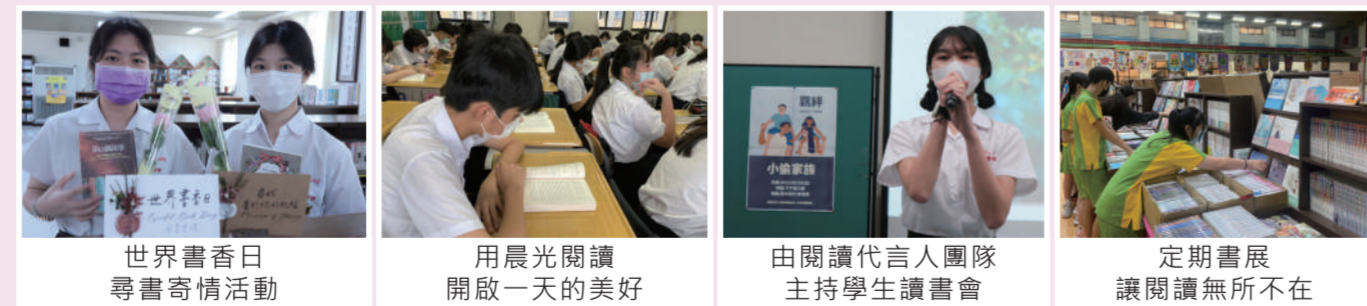
世界書香日尋書寄情活動 | 用晨光閱讀開啟一天的美好 | 由閱讀代言人團隊主持學生讀書會 | 定期書展讓閱讀無所不在

陶冶學生閱讀習慣，是奠定學生學習力的重要工作。靜修多年來推動圖書館利用教育、晨光閱讀、定期舉辦書展、行動書車、世界書香日等活動，並由學生擔任閱讀代言人，自發性舉辦讀書會，讓更多同學有機會接觸各類優良讀物，增廣見聞、培植閱讀素養。