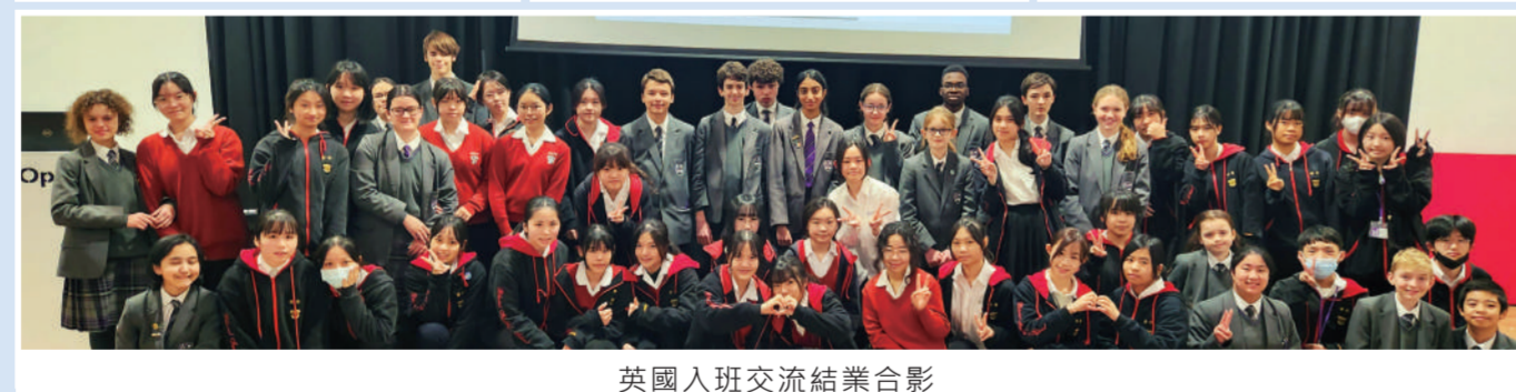
英國入班交流結業合影