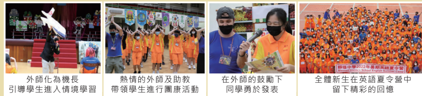
外師化為機長引導學生進入情境學習 | 熱情的外師及助教帶領學生進行團康活動 | 在外師的鼓勵下同學勇於發表 | 全體新生在英語夏令營中留下精彩的回憶

每年暑假，學校以各種暖心、活潑的活動迎接剛踏入靜修的新生們。為期五天的英語夏令營讓學生沉浸在全英語的學習環境中。透過各種主題式的活動，讓同學們從破冰、藝術創作、互動式遊戲到團隊競賽，很快地認識同儕，並建立正向、友善的互動模式。在外師及助教的引導下，能勇敢、自信的開口說英語，成功邁開國際的第一步。