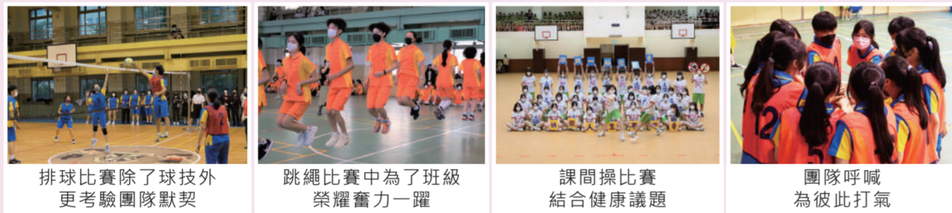
排球比賽除了球技外更考驗團隊默契 | 跳繩比賽中為了班級榮耀奮力一躍 | 課間操比賽結合健康議題 | 團隊呼喊為彼此打氣

體育競賽，除了能夠培養學生從事休閒活動的興趣，並促進學生的健康體能，更能在合作中增進學生彼此的情誼與班級的團隊氣氛。因此學校定期舉辦跳繩比賽、課間操比賽、排球比賽等團體競賽，讓學生在投入熱情參與的過程中，學會運動家的精神與團隊合作的素養。