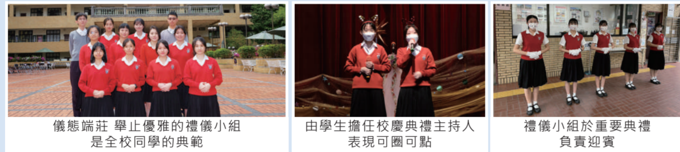
儀態端莊舉止優雅的禮儀小組是全校同學的典範 | 由學生擔任校慶典禮主持人表現可圈可點 | 禮儀小組於重要典禮負責迎賓

靜修每年遴選儀態優良、端莊大方的同學擔任禮儀小組，透過師長培訓及學長姐傳承，能在重要典禮中完美呈現靜修人的氣質。熱心服務的禮儀生們於各項典禮中擔任司儀或接待貴賓，彬彬有禮的儀態也能成為同學的楷模，幫助學校推展品格教育及生活教育。