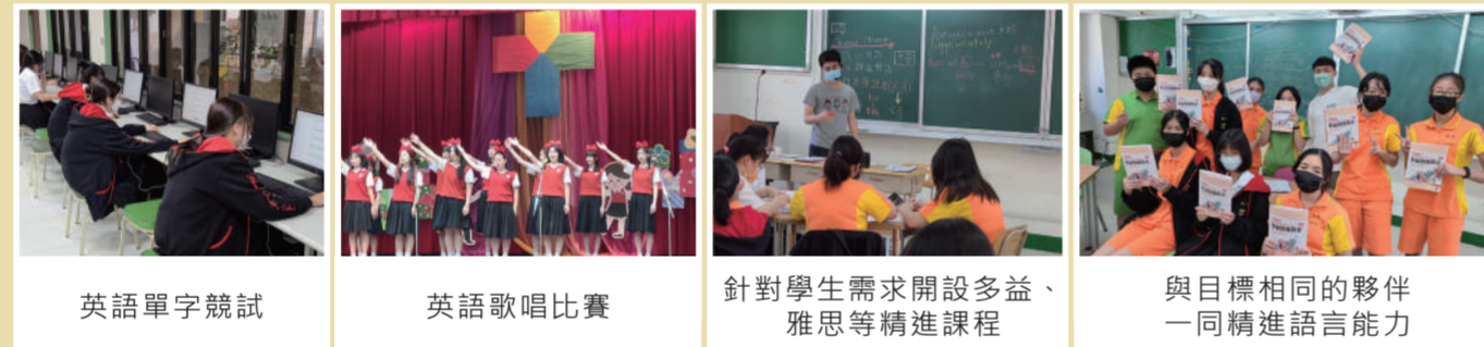
英語單字競試 | 英語歌唱比賽 | 針對學生需求開設多益、雅思等精進課程 | 與目標相同的夥伴一同精進語言能力

學校依學生需求開設多益、雅思等英檢課程。透過精緻小班的專業師資教學，讓學生高效運用週末黃金時段，使檢定課程與學校課程雙軌並進，英文實力能穩定地進步。此外，靜修亦辦理多益、多益普及、全民英檢等校園考，讓靜修同學能專注準備，並在熟悉的校園中應試。