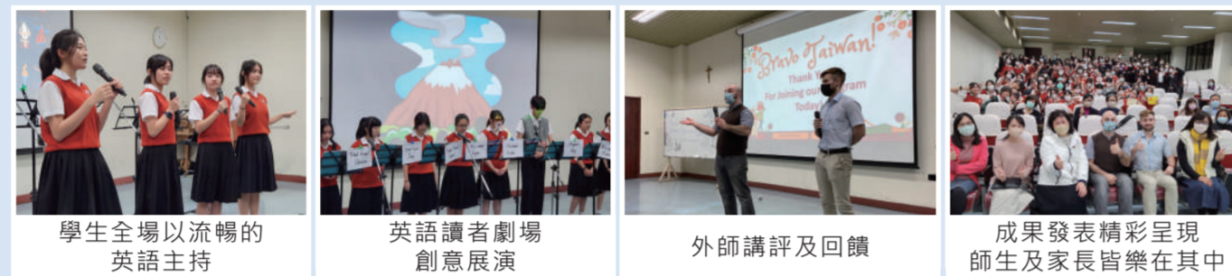
學生全場以流暢的英語主持 | 英語讀者劇場創意展演 | 外師講評及回饋 | 成果發表精彩呈現師生及家長皆樂在其中

高中雙語菁英班透過每週五堂專業外籍教師小班授課，接觸英語會話、基礎雅思、表達藝術、讀者劇場、小說閱讀、文法翻譯、學術寫作等專業課程。互動式適性教學，持續精進學生的英語聽說讀寫與獨立思辨能力。透過各種活動、競賽、作品成果發表，讓每位同學均有體驗式的學習。在趣味橫生的課堂中、師生熱絡的互動裡，發揮學以致用、學以助人的精神。期盼孩子們能以英語為工具，拓展視野，樂於學習，成為具備國際移動力與思維的新世代人才。