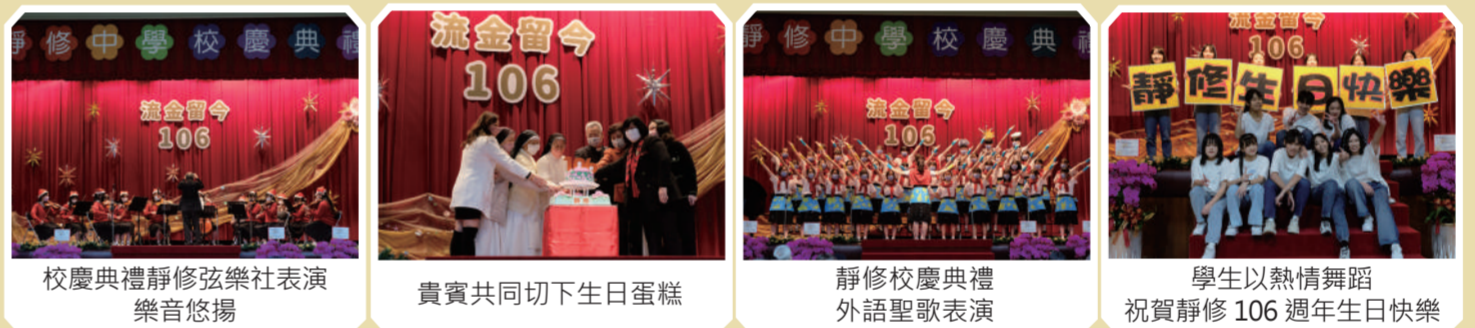
校慶典禮靜修弦樂社表演樂音悠揚 | 貴賓共同切下生日蛋糕 | 靜修校慶典禮外語聖歌表演 | 學生以熱情舞蹈祝賀靜修106週年生日快樂