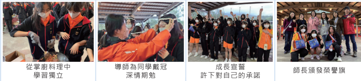
從掌廚料理中學習獨立 | 導師為同學戴冠深情期勉 | 成長宣誓許下對自己的承諾 | 師長頒發榮譽旗

高一成長營，透過野炊、漆彈、高空跳塔、探索教育活動，學生能展現秩序與紀律，並透過團隊合作增進班級凝聚力，甚至突破恐懼完成個人挑戰。最後的成年禮儀式上，許下對自己與班級的承諾，期許能為目標付出實踐，追求不斷的進步，以成就更好的自己。