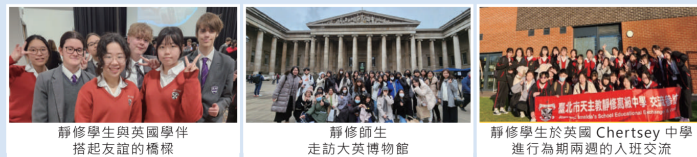
靜修學生與英國學伴搭起友誼的橋樑 | 靜修師生走訪大英博物館 | 靜修學生於英國Chertsey中學進行為期兩週的入班交流

學生們住在英國當地的接待家庭，除培養學生獨立性及處事能力以外，更深入了解當地的飲食、生活習慣及文化等，每天都能練習英文，體驗當地生活，學習英文更事半功倍。假日時，在藍牌城市導覽員的帶領之下，學生造訪了牛津大學、基督學院、溫莎城堡、倫敦眼、大英博物館、西敏寺及白金漢宮等知名景點，深度探索英國悠久的歷史文化和建築美學，真正實踐「讀萬卷書，行萬里路」之精神。