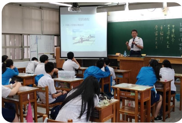
家長職業分享:機師