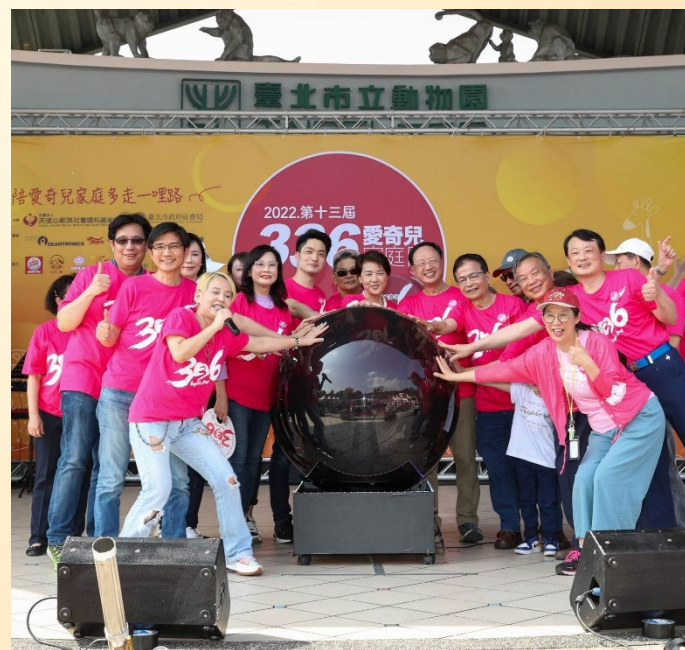
第十三屆336愛奇兒家庭日啟動儀式