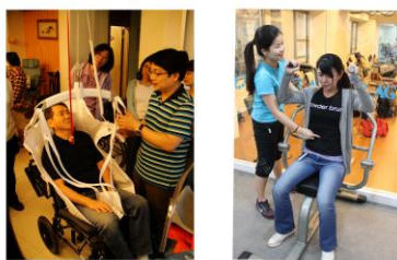
安全省力轉移位工作坊

兼顧學理與高齡市場現況，課程規劃活潑，採多元學習方式，海外研習、國內參訪、研討會、工作坊與大師專題演講等。