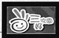
臺北市立忠孝國民中學112學年度合作社預算表