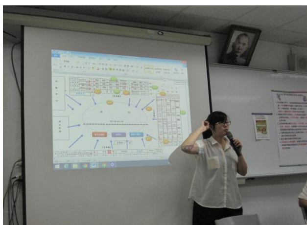
說明：總務主任說明避難引導路線及工作分配。