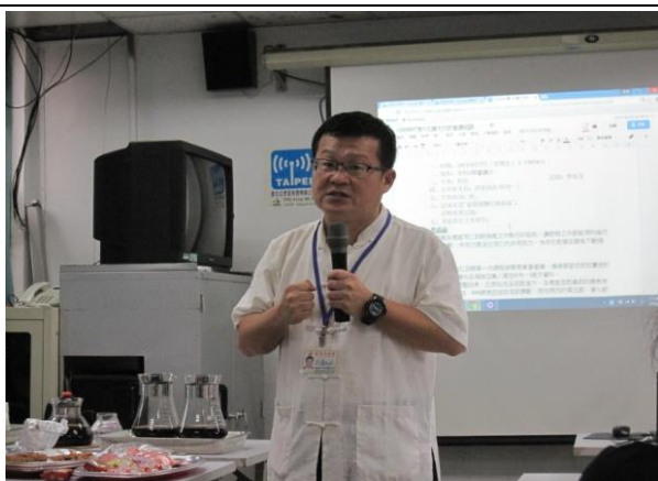
說明：校長說明地震演練及防災的重要性