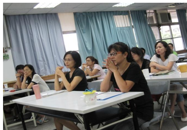
說明：教職員工仔細聆聽