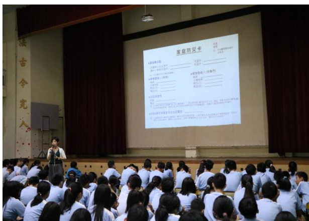
說明：家庭防災卡的重要性必要性說明。