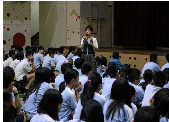
說明：學生仔細聆聽