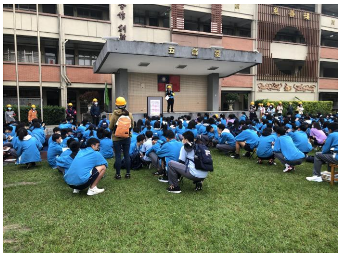
生教組宣導避難逃生觀念