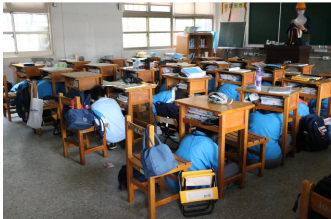
立即躲到桌下 趴下、掩護、穩住