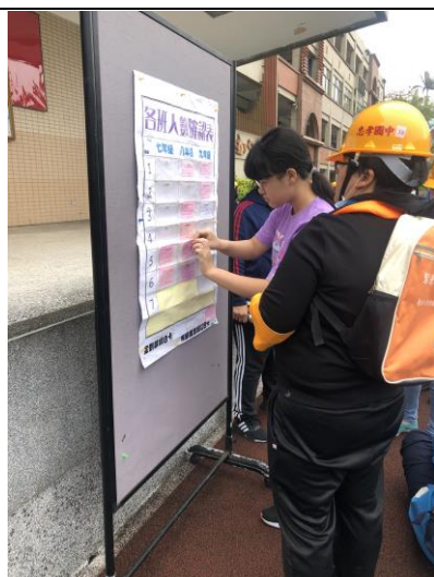
各班人數回報統計