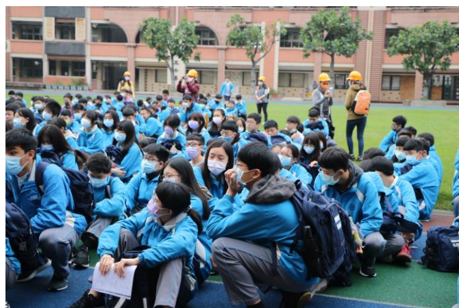
學生專注聆聽防災避難宣導