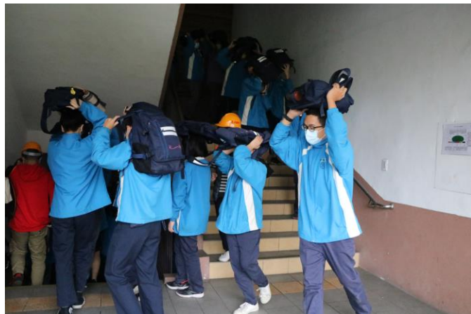
利用書包、隨手物品或雙手保護頭部