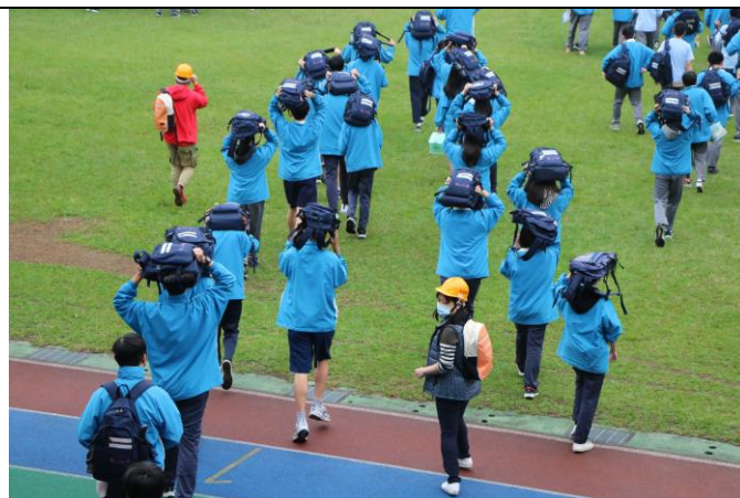
避開校園有危險的地方