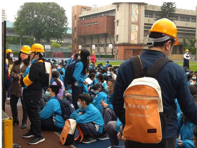
各班都確實攜帶緊急避難包