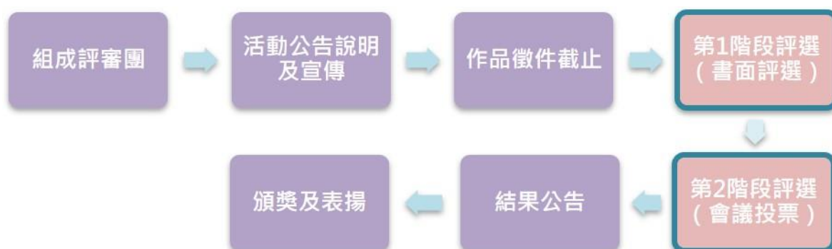
圖 防災士 LOGO 設計徵選活動流程

(2) 第1階段將請委員簽署評選委員確認單(如附件8)，以確認參與本次評選(如圖)。