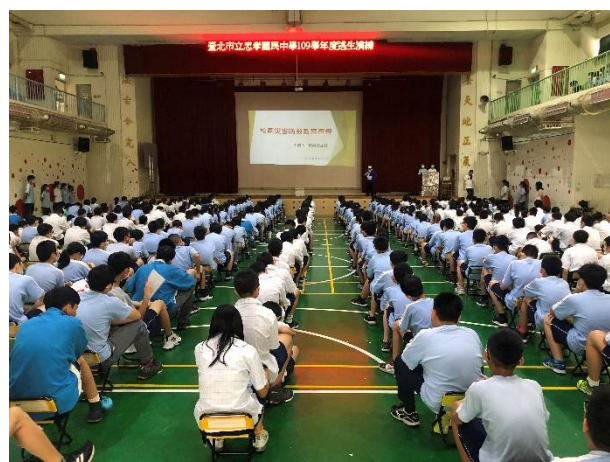
說明：家庭防災卡的重要性必要性說明。