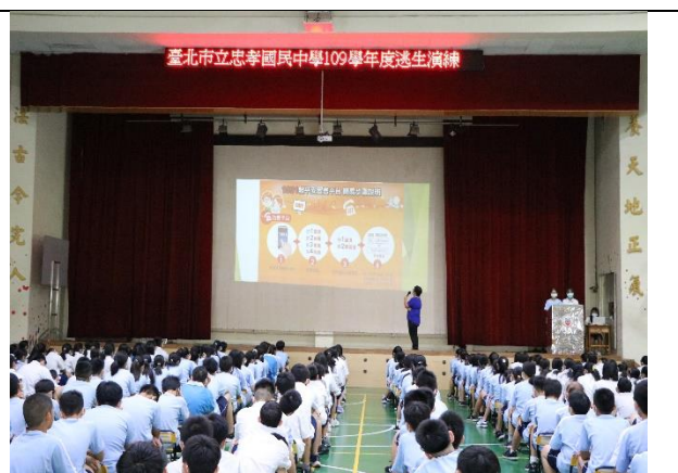
說明：學生仔細聆聽