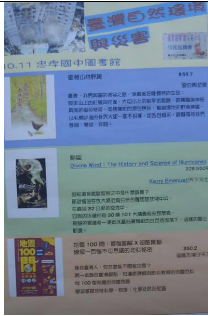
防災教育主題書展